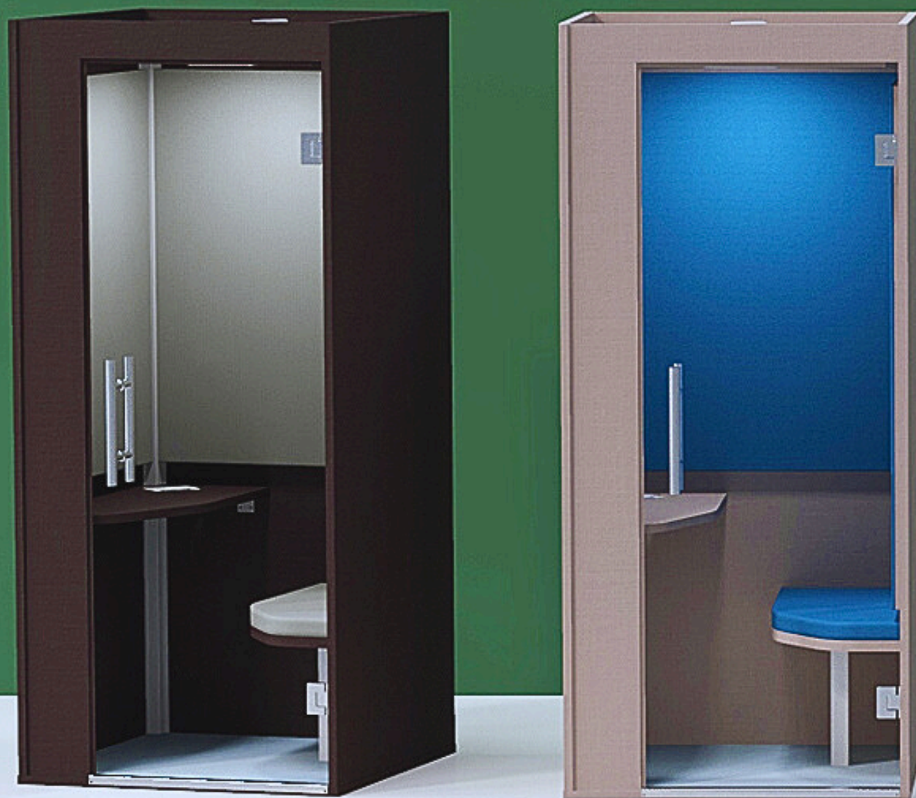
Cabine telefônica - Phone Booth